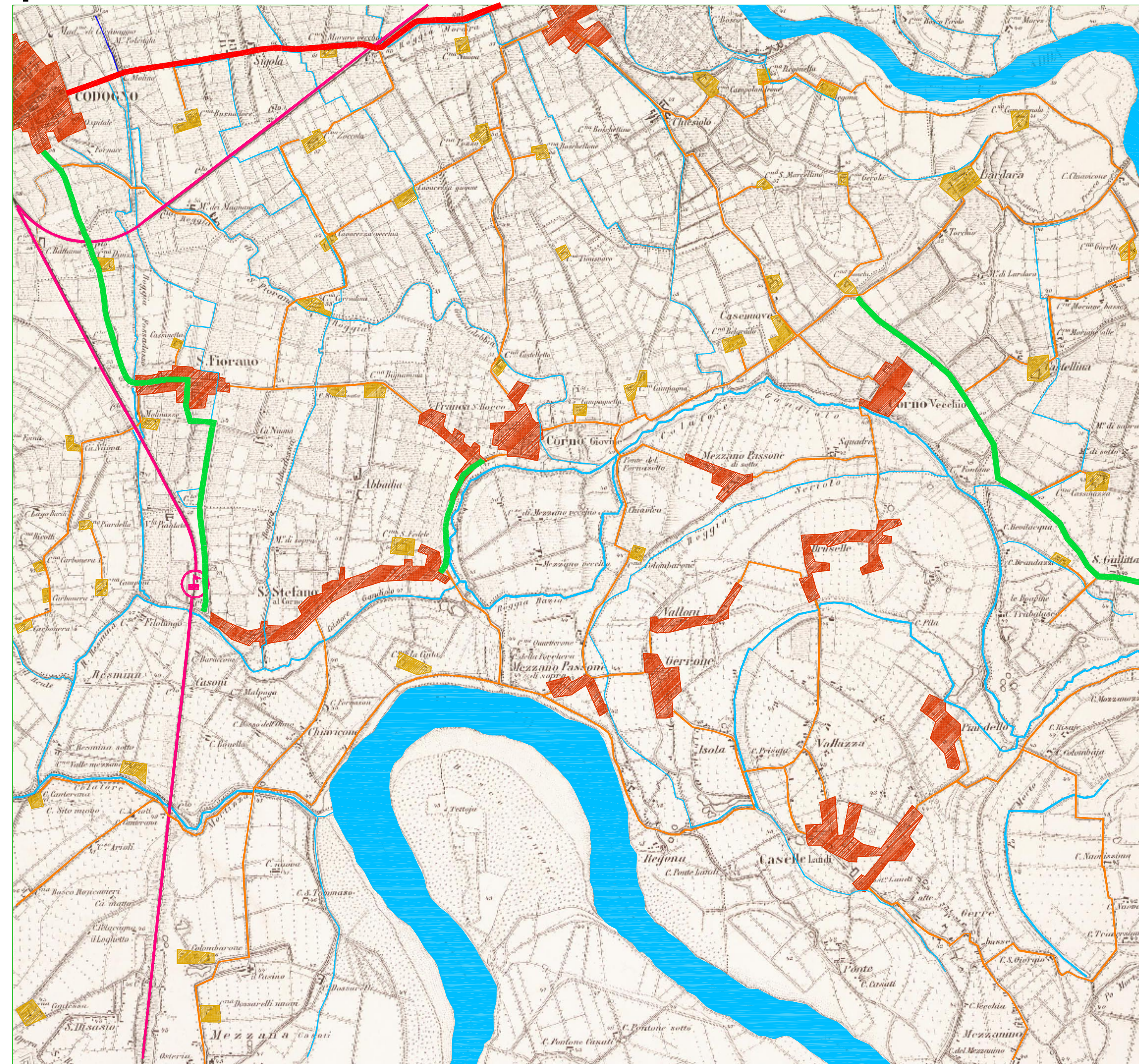
Estratto IGM (prima levata 1889)